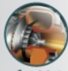
เทอร์โบแปรผันช่วงระยะอินเตอร์คูลเลอร์