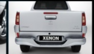
กันชนท้ายสีเดียวกับตัวรถ