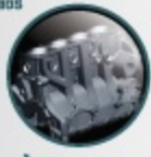
เชือสูบแบบสนาทุบ และปลอกตะกั่วยาลิมสูง