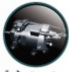
เข็มขัดแรงดันสูงแบบกลึงแข็ง