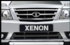
กระจังหน้าโครเมียม

ดีไซน์ลงตัว คำนึงถึงการใช้งานเป็นหลัก พสานทั้งความแกร่ง และความสวยงามได้อย่างกลมกลืน