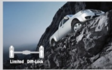
ระบบล็อกเฟืองท้ายอัตโนมัติ (Limited Diff-Lock)

รวมทั้งระบบช่วงล่างที่แกร่ง ทนทาน พลัดจากหลีกหล้าคุณภาพสูง จึงพร้อมลุยในทุกสภาพถนน