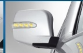
ไฟสัญญาณบนกระจกของข้าง