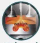
หัวฉีดเชื้อเพลิงแนวตั้ง กลางลูกสูบพร้อมลูกสูบคู่ มีวาล์วแบบไดนาโมตรงกลาง