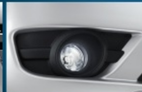
ไฟตัดหมอกหน้า