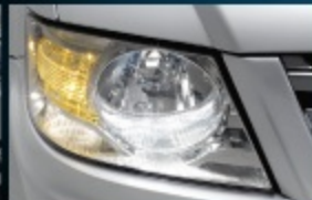
ไฟหน้าขนาดใหญ่แบบ Integrated